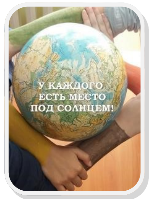
(фото-эмблема 6 а класса)

Среди учащихся начальной школы был проведён конкурс рисунков , дети изобразили свое видение единения, мира, дружбы. Среди старшекласников был проведён конкурс фото - эмблемы «Мы вместе».